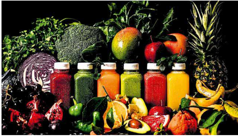
Alles so schön bunt hier. Aber auch gesund? Darüber informieren sich Veganer:innen häufig auf Onlineforen

Veganer:innen informieren sich oft abseits offizieller Empfehlungen über gesunde Ernährung. Forschungsbedarf besteht für die Ernährung von Kindern und Schwangeren